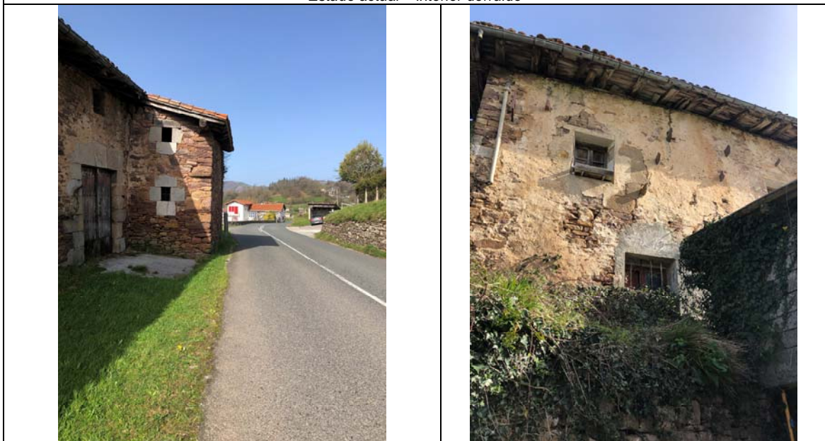
Estado actual – fachada lateral