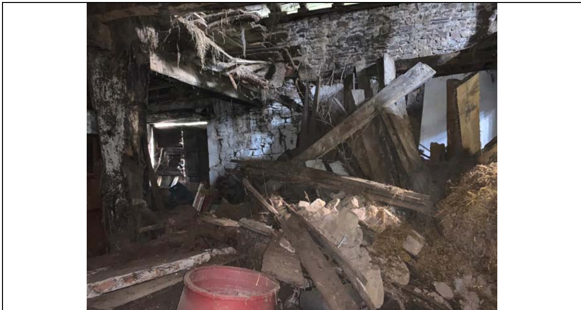
Estado actual – interior derruido