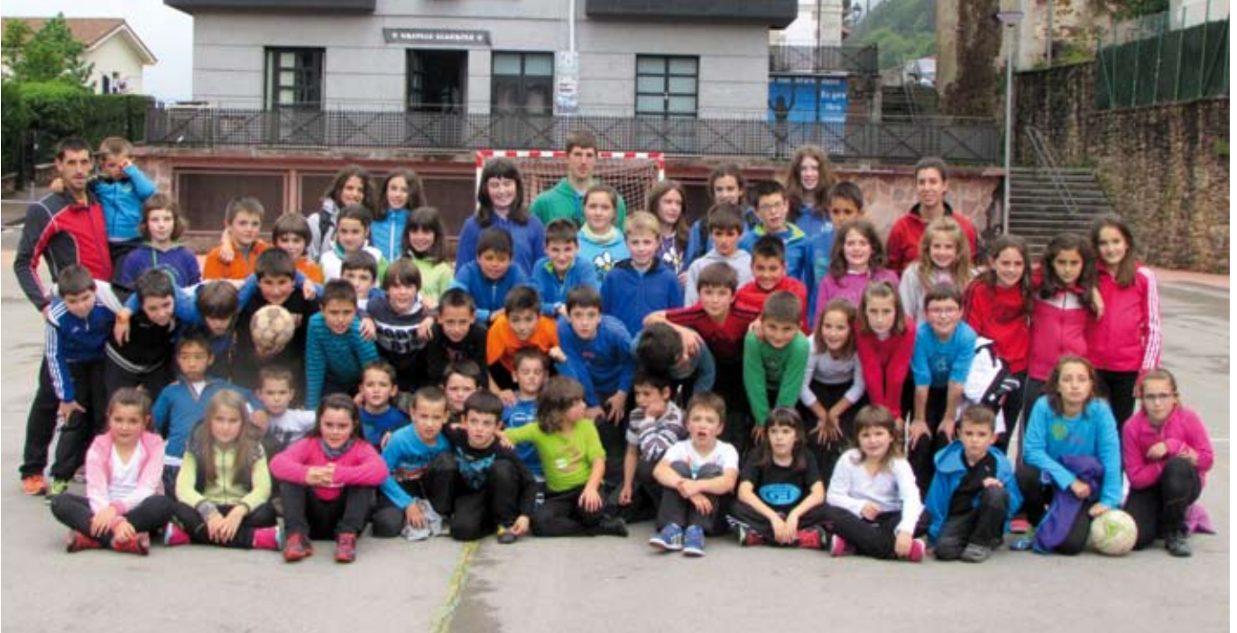
Ikasturtean zehar eskola-kirolean ibili diren gaztetxoak.