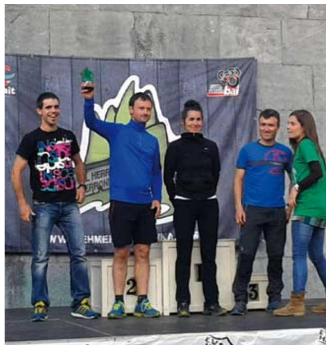
Aldin Kirol Elkarteko mendi-korrikalariak Leitzan, taldekako sailkapeneko 3. saria jasotzen.

2. egin zuen, 19 ordu eta 7 minutuko denbora eginda; eta, bukatzeko, uzta-laren 10etik 11rako gauean Goierriko Bi Haundietan 2. helmugaratu zen, lasterketako 88 kilometroak egiteko 10 ordu eta 18 minutu behar izan ondoren.